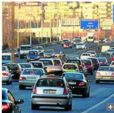
De momento, en Granada, los coches funcionan con conductor.

Su equipo ha implantado los avances del vehículo que circula solo a usos más económicos, como una silla de ruedas que se dirige por comandos de voz y facilita el día a día de un enfermo impedido.