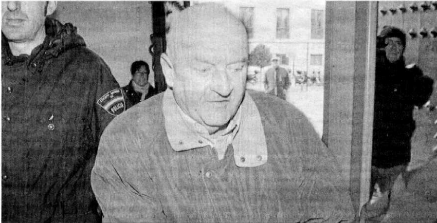
Imagen del ahora condenado a su llegada a la Audiencia Provincial.

La víctima le había dado trabajo en un camping y le había permitido estar en una autocaravana en el jardín de su casa