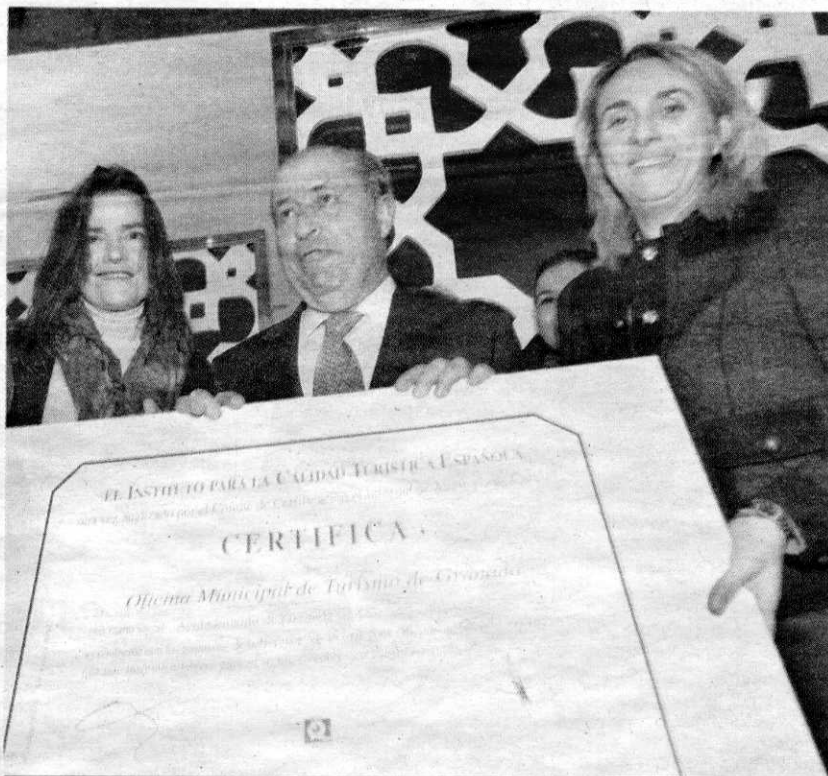
El alcalde y la concejal de Turismo reciben el galardón.