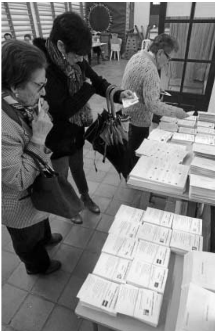
Varios ciudadanos eligen sus papeletas en las últimas generales. G. H.

A pesar de la diferencia, el PP cae casi dos puntos con respecto al verano y el PSOE sube más de tres. Ortega declaró que estos datos no garantizan que los populares logren la renta suficiente para poder gobernar en solita-