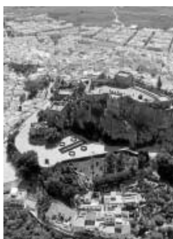
Vista aérea del castillo de Salobreña.