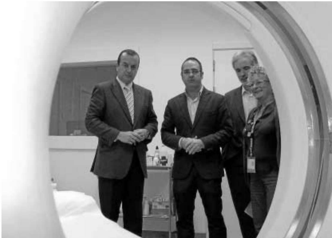
El delegado de Salud (izqda.) ayer durante su visita al Chare de Loja.

Las especialidades que comenzarán a funcionar a partir de la segunda semana de febrero serán Otorrinolaringología, Reumatología y Dermatología, mientras que