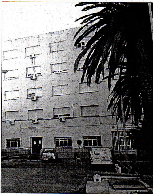
Exterior de la Facultad de Enfermería.

"Si hay algún tipo de solución en la que podamos ayudar en la forma de cederles alguna hora o algún acuerdo, he oído profesores asociados, si eso llega a buen término, es legal e implica alguna gestión por parte del Ingesa nosotros lo vamos a apoyar, se lo vamos a facilitar, incluso aunque económicamente no nos sea rentable", manifestó el director territorial, conocedor de la situación por su reciente puesto como coordinador de equipo y con algunos de estos enfermeros bajo su tutela.