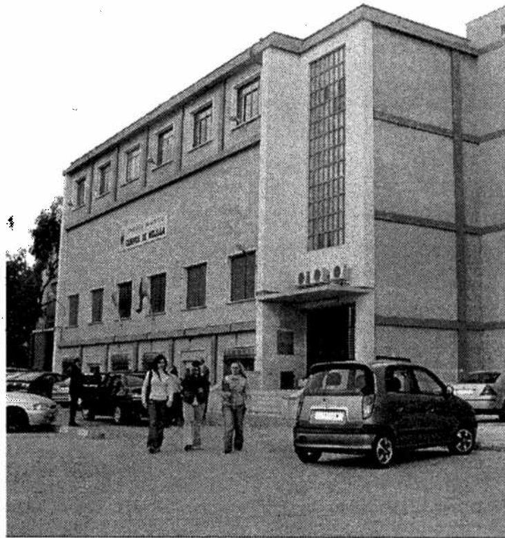
El seminario se llevará a cabo en el Campus de Melilla.

El proyecto 'Reconstruir la vida en la Frontera' cuenta con la financiación del Centro de Iniciativas de Cooperación al Desarrollo (Cicode) de la Universidad de Granada.