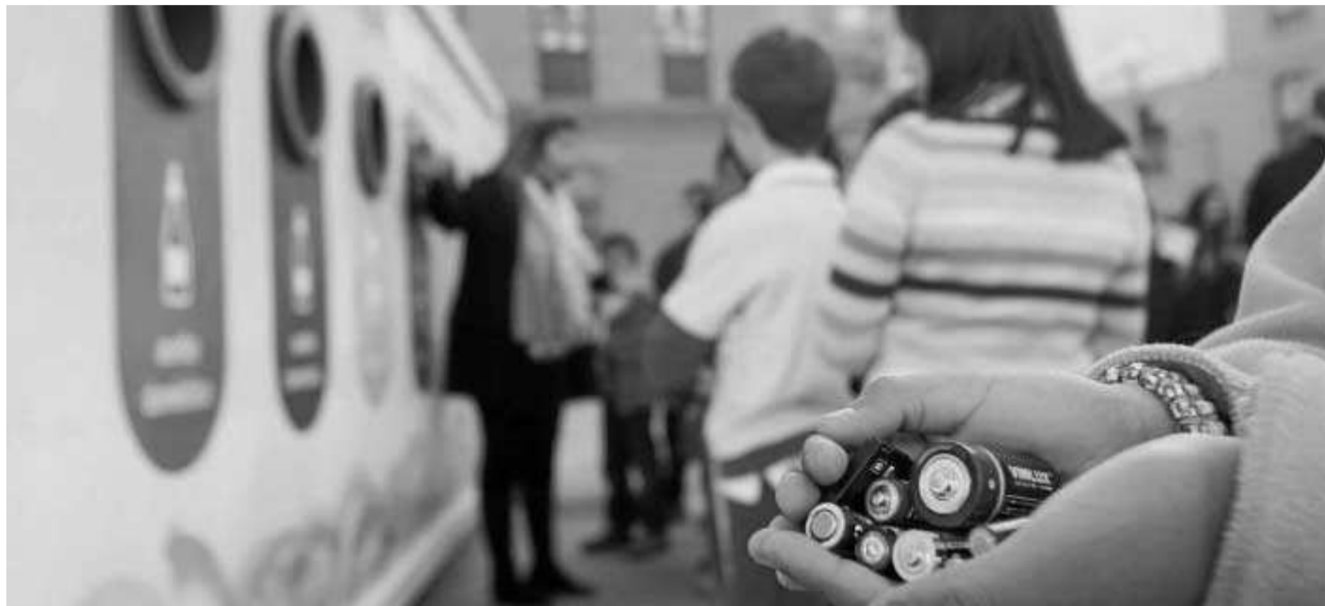
Los alumnos del colegio Tierno Galván utilizan ya el nuevo Ecomparque móvil.