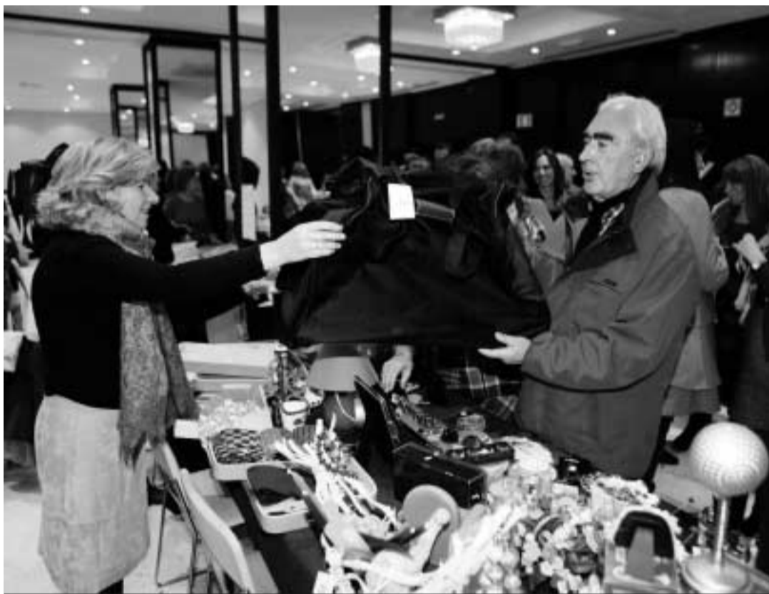
En el mercadillo se pueden encontrar productos de lo más variados.

Según asegura el Movimiento 15-M en un comunicado, para llevar a cabo el tercer intento de desahuciar a esta vecina del Albaicín, el Cuerpo Nacional de Policía ha solicitado a los juzgados poder llevar a cabo el desahucio sin necesidad de avisarlo previamente. “Esta estratagema deja entrever la imposibilidad de estos agentes de llevar a cabo este tipo de acciones, sin echar mano de cuestionables métodos”.