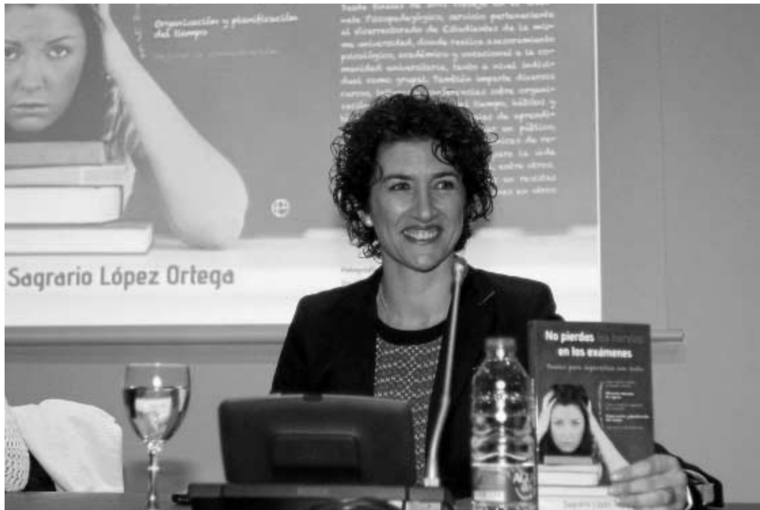
La escritora ayer, durante la presentación del libro.