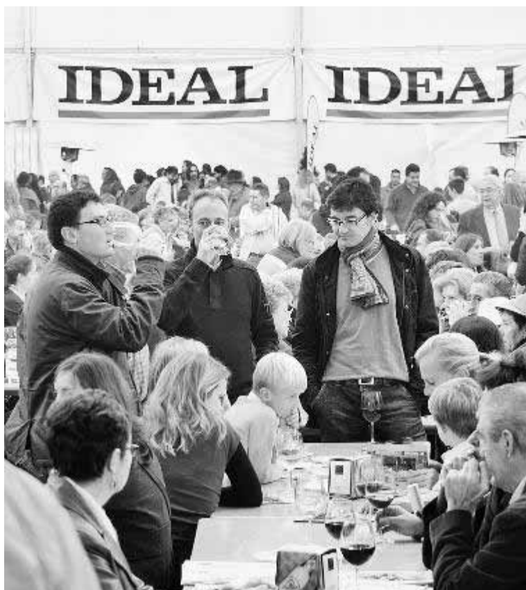
Imagen de las jornadas durante la pasada edición.

Durante cuatro días los buenos vinos de Granada serán nuevamente protagonistas de una muestra que surgió en el año 2008 y ha sido todo un éxito en sus ediciones precedentes. Se espera que, una vez más, miles de personas se acerquen hasta la carpa instalada junto al Palacio de Congresos para saborear la producción de las bodegas de la tierra, cuyos caldos cada vez son más conocidos, tanto en nuestra provincia como fuera de ella. Allí, en