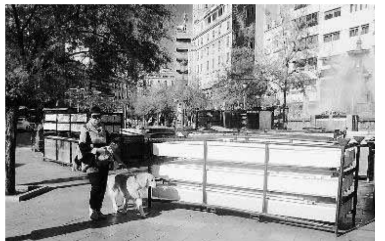
Los elementos para los puestos están ya en Puerta Real.