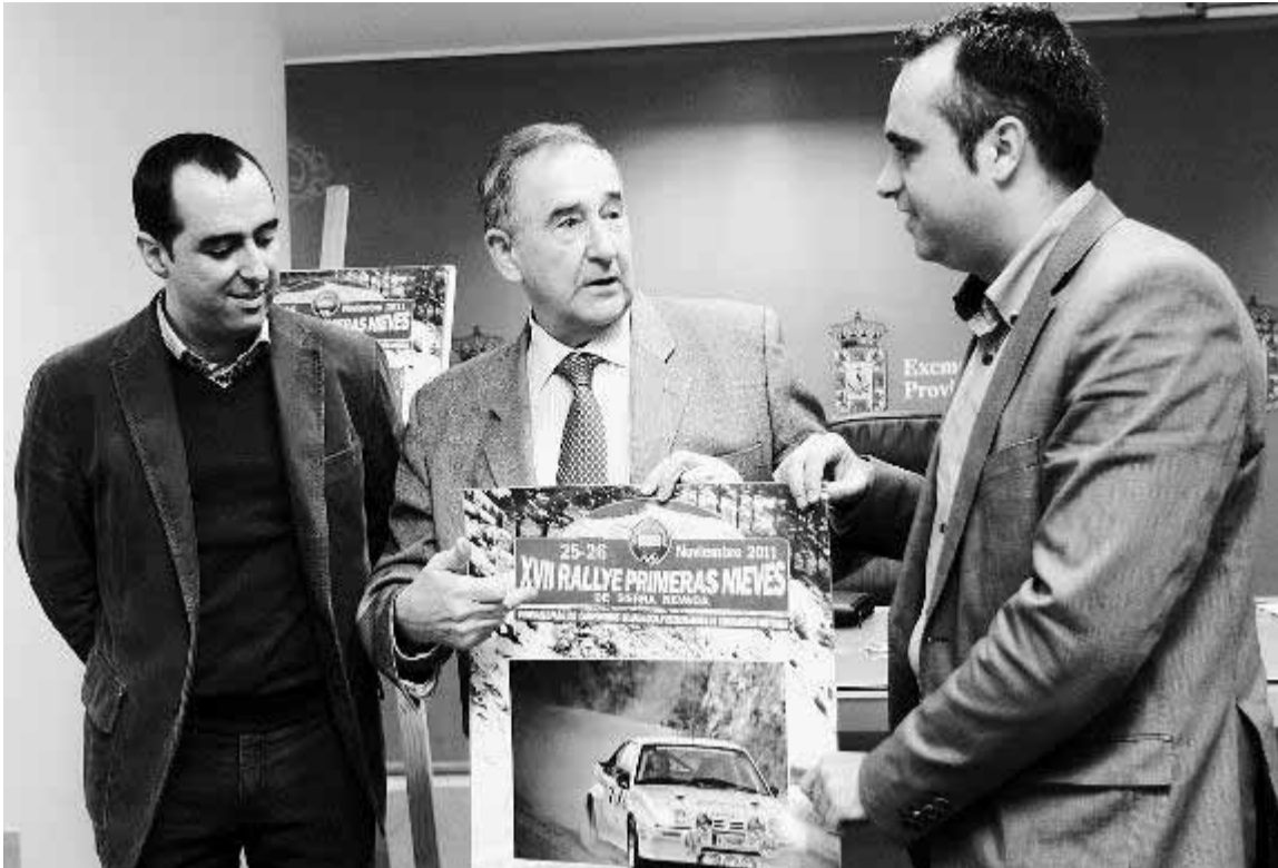
Los organizadores muestran el cartel del rally en la presentación de ayer.