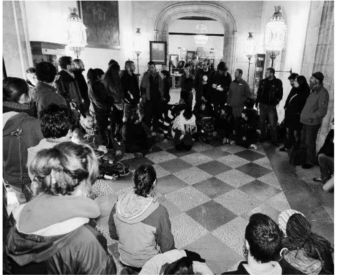
Miembros del colectivo, en el interior del Hospital Real.