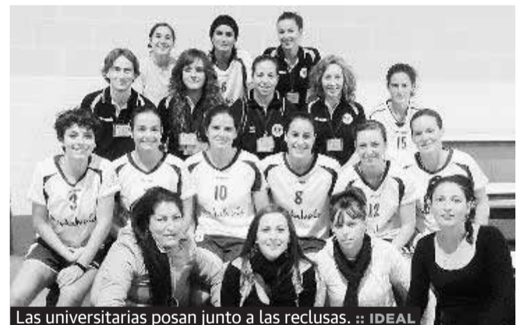
Las universitarias posan junto a las reclusas.