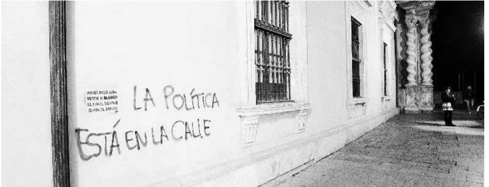
El edificio monumental es blanco de los vándalos.