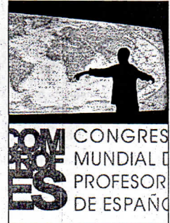
Imagen del evento.