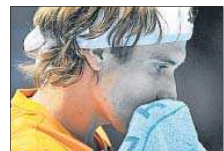
El tenista David Ferrer, pensativo, ayer.

Antes de la derrota de Ferrer, el suizo Roger Federer se aseguró su pase a la penúltima ronda dando una lección al escocés Andy Murray, el favorito del público,