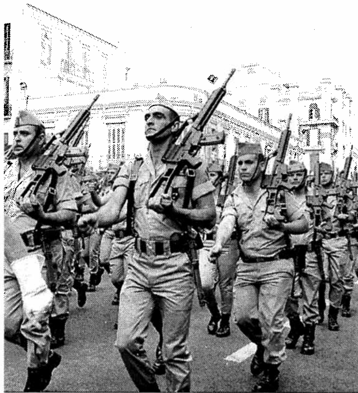
Las ayudas se conceden con el objeto de difundir la cultura de Defensa.

El plazo para presentar las solicitudes finaliza el próximo día 23 de diciembre.