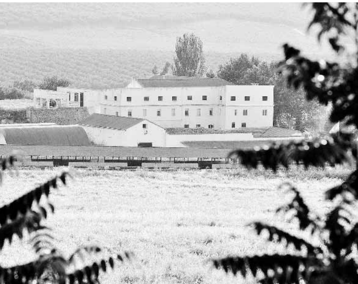
una enorme finca de olivar que se extiende a ambos lados de la carretera. :: CHAPA

rrirle al joven para que este se ahogara, ya que sabía nadar», según le relataron sus tíos.