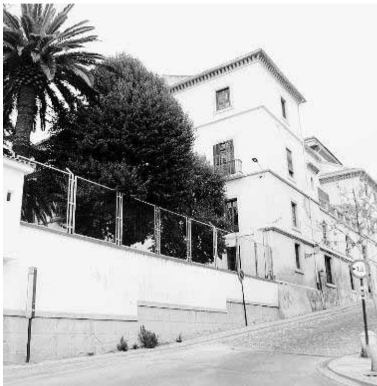
El antiguo convento de La Merced, objetivo de la UGR.