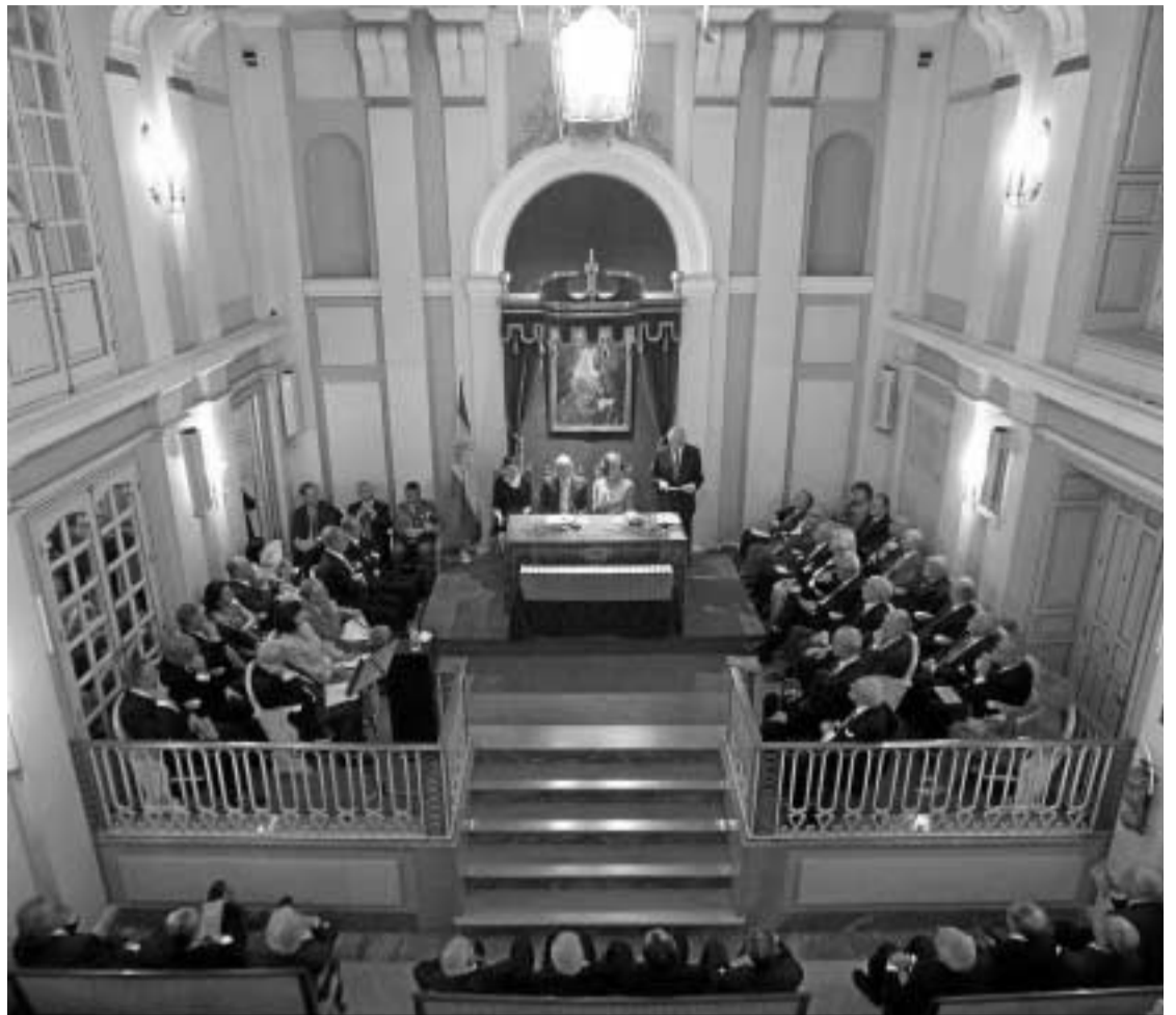
Presentación, el pasado 26 de mayo, del Diccionario Biográfico.