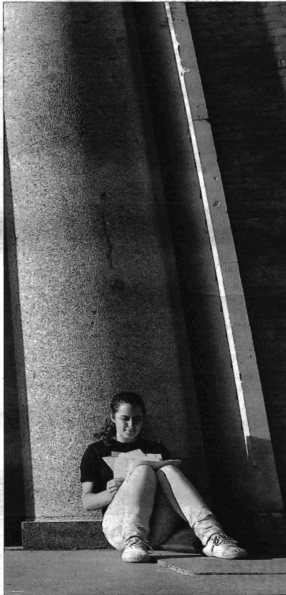
La falta de salidas profesionales influye en el abandono escolar.

Hay incongruencias de todo tipo. La crisis está llevando al paro a los arquitectos y a los ingenieros de obras públicas, pero ambas carreras mantienen una elevada nota porque