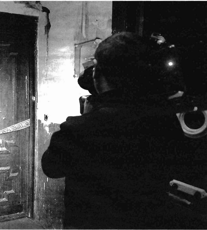
Los expertos proponen seleccionar con cuidado las imágenes sobre crímenes machistas.

Contador disfruta de su particular vida en rosa