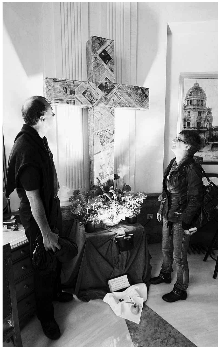
Cruz del Hotel Victoria, dedicada al Periodismo.