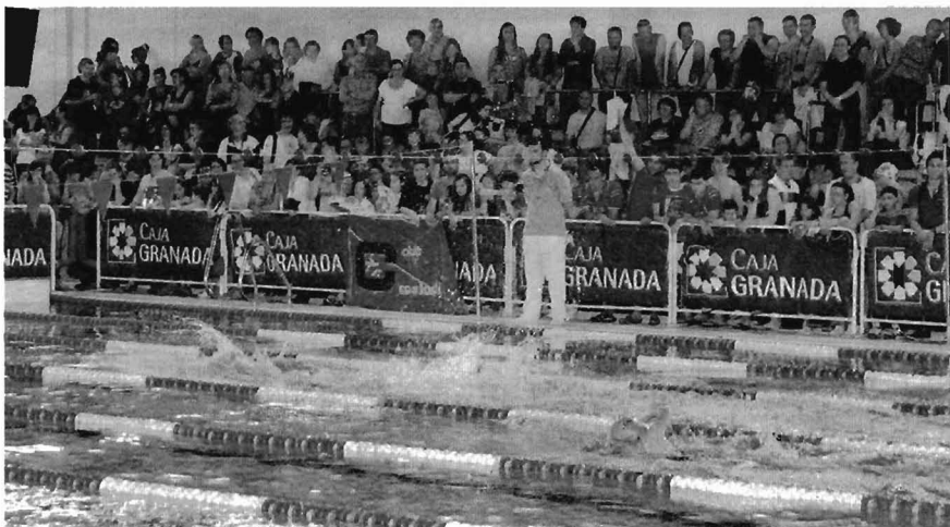
Ambientazo. El público abarrotó las instalaciones de La Chana durante todo el fin de semana

que todos los niveles han tenido cabida, ha permitido que clubes de todo el panorama nacional no se lo hayan pensado dos veces a la hora de hacer efectiva su participación. El CDU ha dado el primer golpe encima de la mesa, ahora tendrá que reafirmar su condición de favorito en los próximos campeonatos autonómicos.