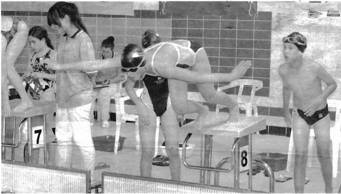
Salto. Una nadadora toma el testigo de un compañero en una carrera por relevos :: QUIJANO

En España tenemos algún deportista capaz de rellenar nuestro famoso círculo con increíble solvencia como nuestro sempiterno ejemplo Rafa Nadal, que hasta con la difícil letra de la 'z', acaba rellenado el rosco con algo que ni siquiera es: zurdo. ¡Les esperamos en el próximo programa!