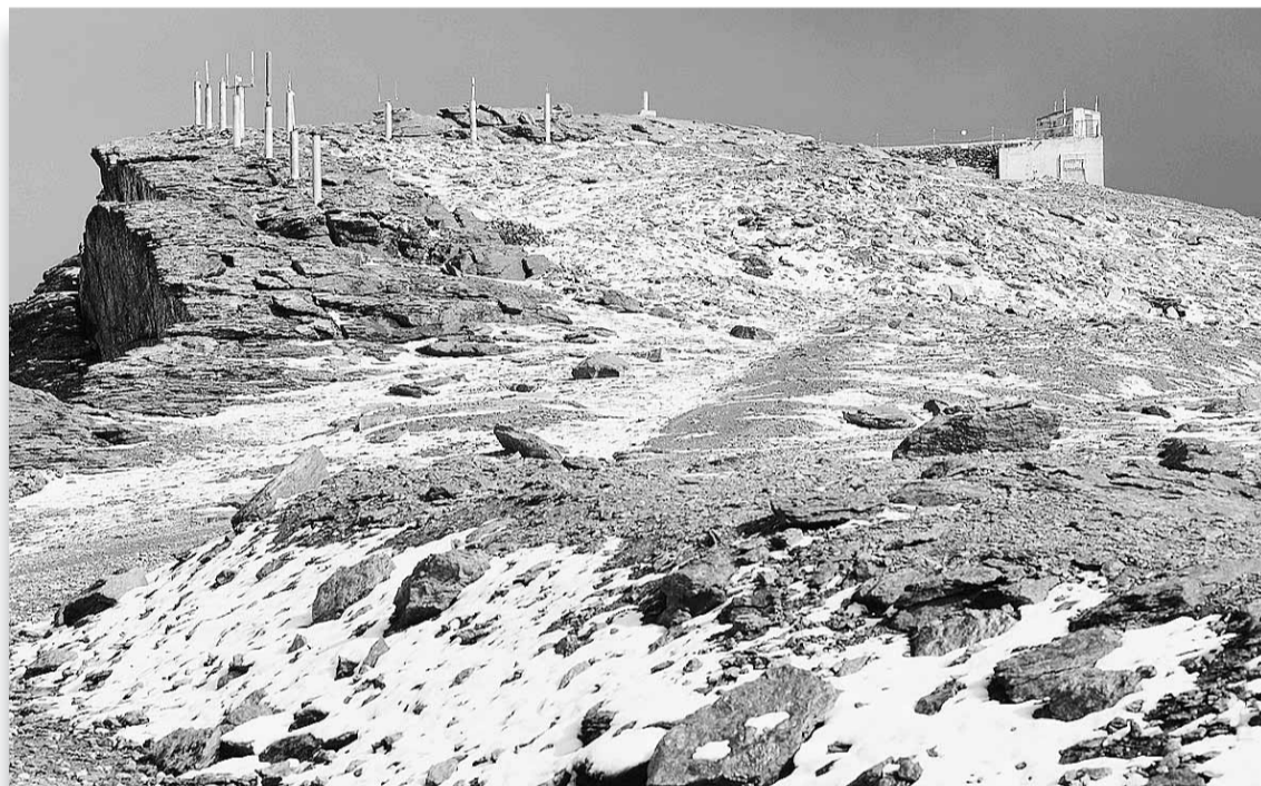
Cima. Instalaciones en el picacho del Veleta.

Por iniciativa del Ministerio de Información y Turismo el año anterior se había elaborado ya un proyecto de ideas que contemplaba nuevamente la unión de la última estación del tranvía, el ba-