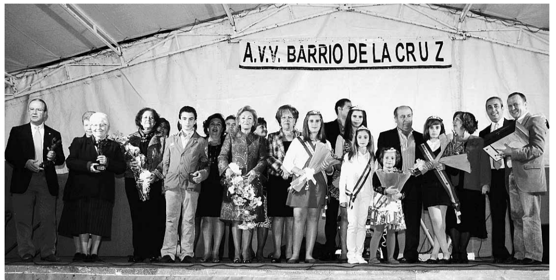
Reina y damas, autoridades, premiados y miembros de la Asociación de Vecinos.