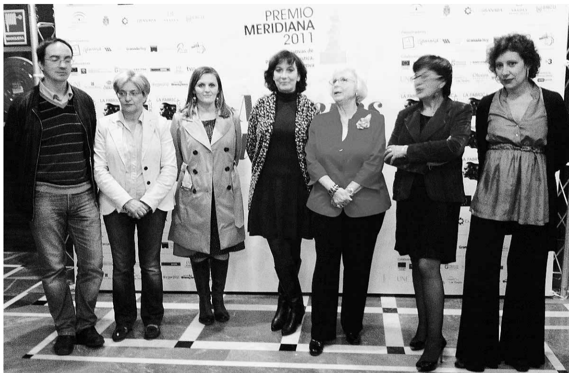
Imagen de los participantes en la gala final del festival Mujeres del Cine.