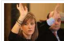
Último Pleno de Pérez-Espínosa