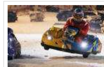
Alonso, el mejor sobre la nieve