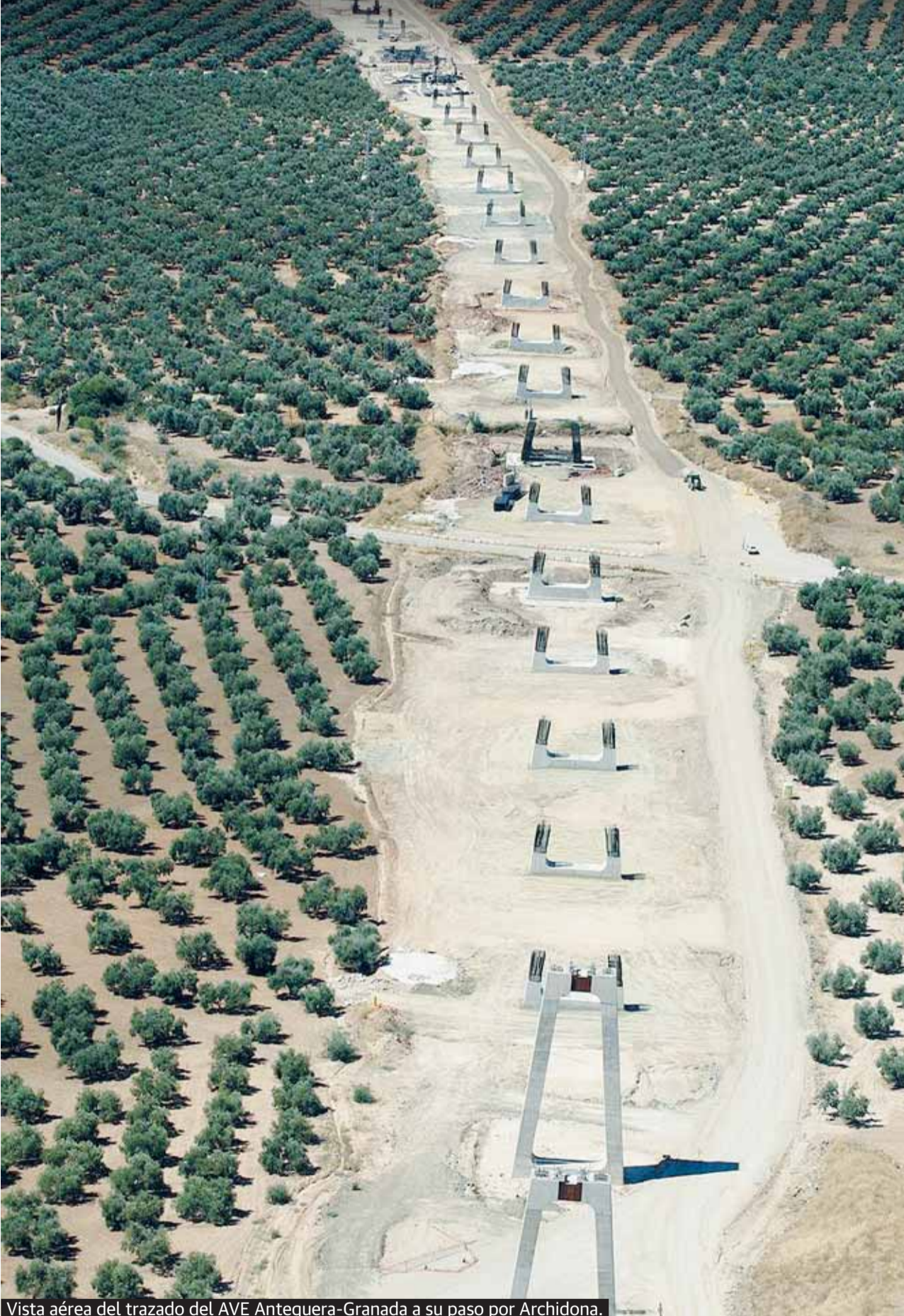
Vista aérea del trazado del AVE Antequera-Granada a su paso por Archidona.