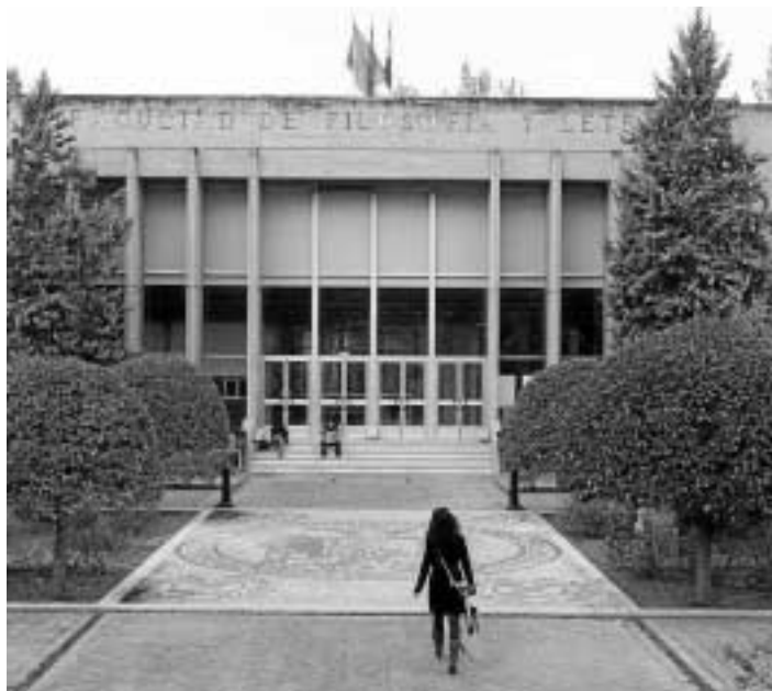
La Facultad de Letras, en Cartuja.