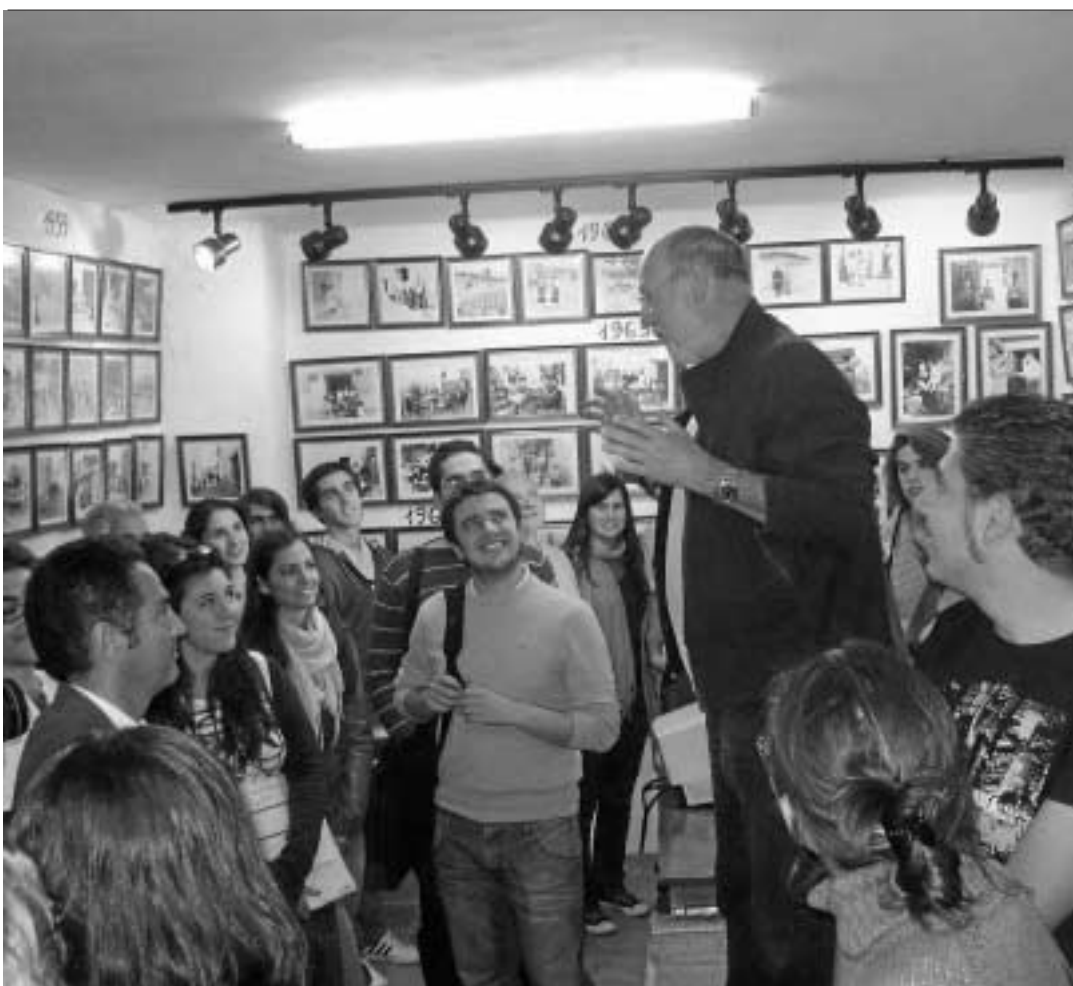
Los alumnos, durante la celebración del encuentro.