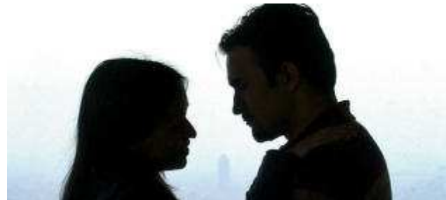
La mujer sufre la tristeza con más frecuencia: el hombre, la vergüenza.

EFE / GRANADA Las mujeres sienten sus emociones con mayor intensidad que los hombres cuando tienen un conflicto con su pareja, mientras que los varones, que expresan en mayor medida sentimientos como la furia o el desprecio, son los que con más frecuencia provocan los problemas entre ambos por este motivo.