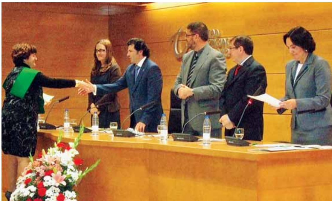
Un momento del acto institucional celebrado en la facultad granadina.