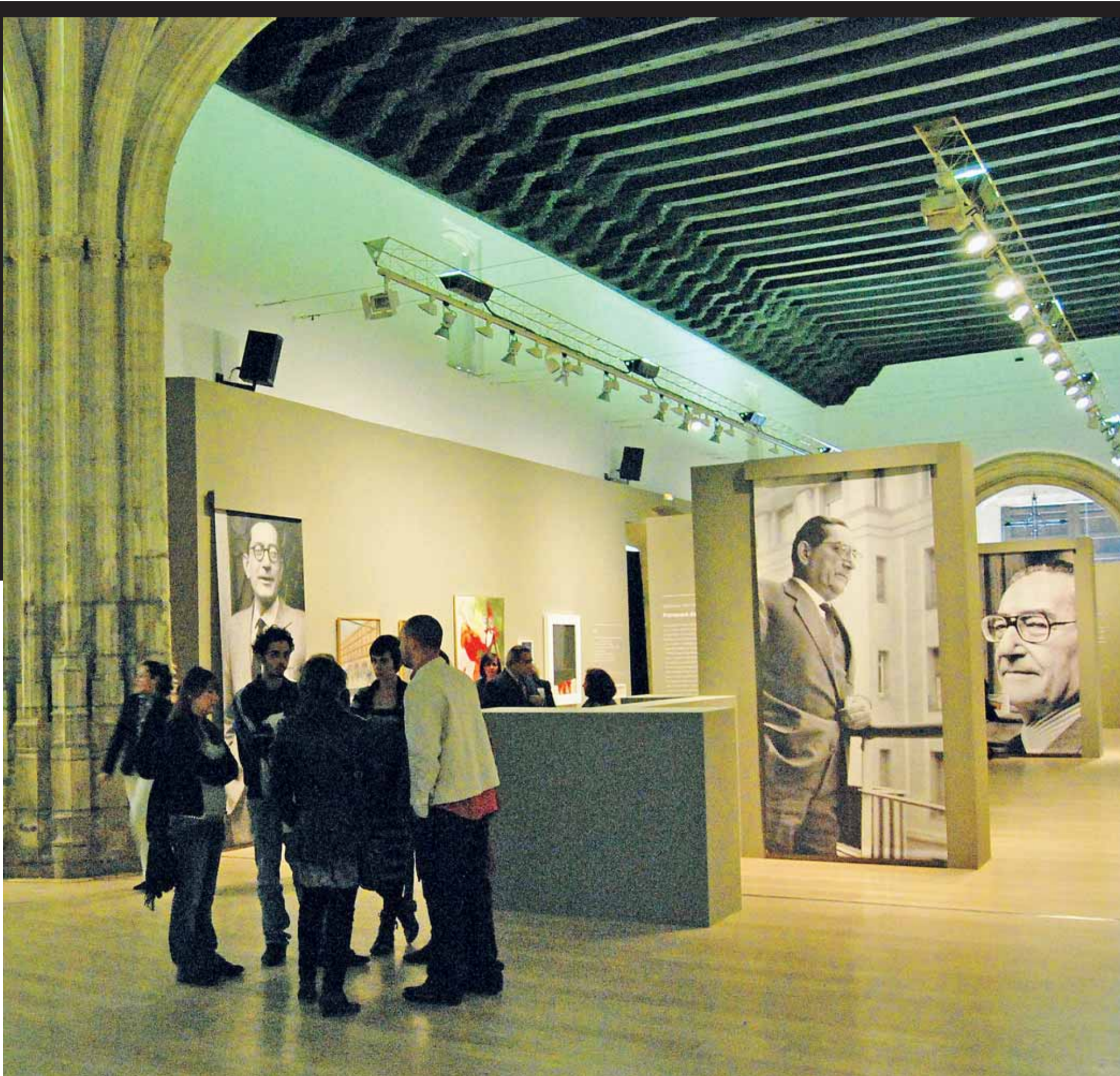
Crucero del Hospital Real. Imagen general de la exposición 'El contenido del corazón' en el Hospital Real.