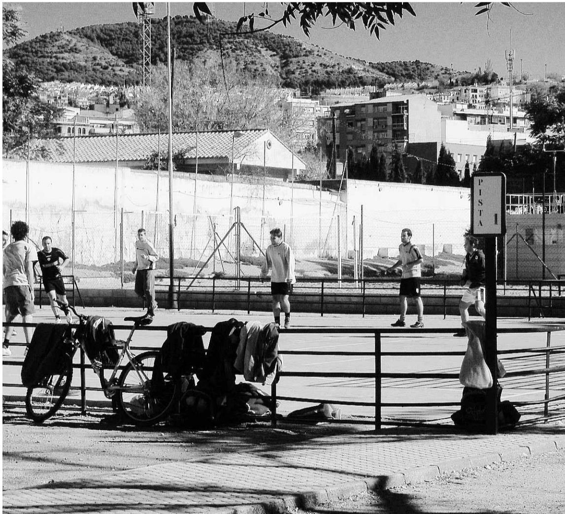
Instalaciones deportivas de la UGR.

El Centro de Actividades Deportivas cuenta con unas amplias instalaciones en las que se ofrece la posibilidad de realizar un amplio abanico de actividades a toda la comunidad universitaria. Esas actividades, el centro las divide en dirigidas, orientadas a la salud, aprendizaje deportivo, competiciones universitarias y por supuesto de uso libre.