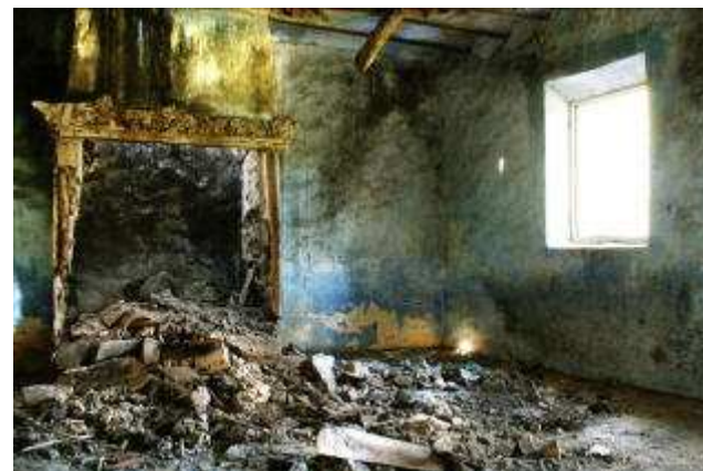
Foto de Javier Tasso. // Más información en www.escuelaartegrana.com