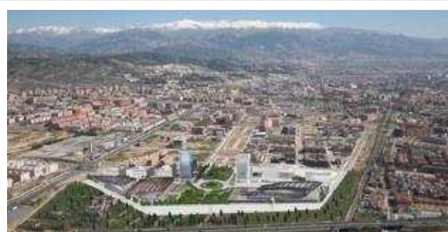
Recreación de la villa olímpica de la Universiada 2015, según la propuesta realizada por el Ayuntamiento de Granada. Ayuntamiento de Granada

EUROPA PRESS El Ayuntamiento de Granada quiere cambiar la ubicación prevista para la villa olímpica de la Universiada de Invierno 2015, proyectada junto a los túneles del Serrallo, y construirla en unos terrenos de propiedad municipal situados frente al Parque Norte de Bomberos al objeto de ahorrar "tiempo" y, al menos, 14 millones de euros.