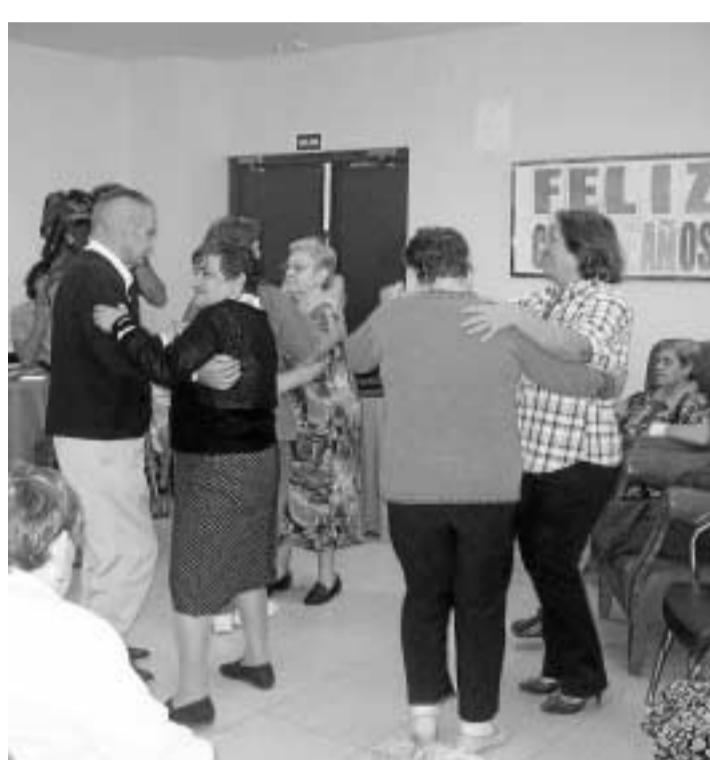
Un momento del taller, ayer en la residencia La Milagrosa.

Con este material, han diseñado un algoritmo de clasificación automática que, al comparar una imagen con las de muestra, es capaz de realizar su clasificación.