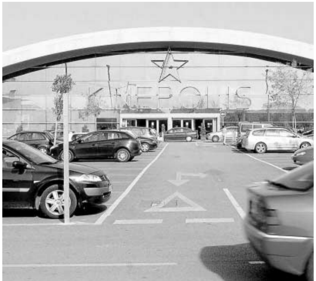
Kinépolis lanza en España 'Ladies and the movies', una experiencia pionera en el cine.