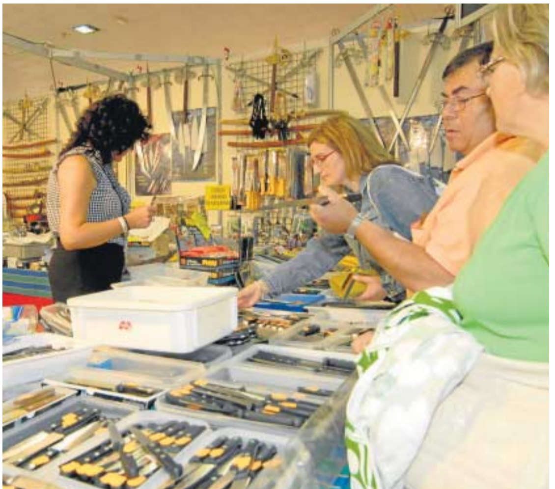
Fermasa abrirá sus puertas este sábado con expositores de lo más variados.

En Fermasa expondrán empresas del sector de los suministros, el turismo, inmobiliario, financiero, maquinaria o energías renovables. Procederán de Granada, Andalucía y el resto de España, pero una de las novedades que despertará mayor interés será la exposición de una réplica del vagón del Metro de Granada a tamaño real "para ir conociendo sus características funcionales" y diseño por primera vez. Todo ello contribuirá a una feria "atractiva y especial donde se combina el conocimiento de productos con las grandes novedades".