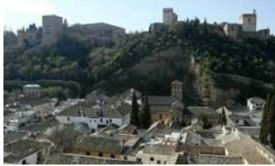
Los Obama visitarán mañana la Alhambra