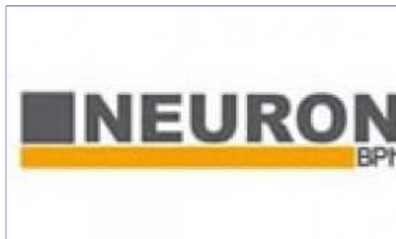
Logotipo de Neuron