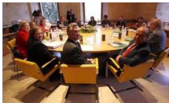
Pleno del Patronato de la Alhambra

El consejero de Cultura de la Junta de Andalucía, Paulino Plata, ha presidido esta mañana, en el Palacio de Carlos V, la primera reunión del año del Pleno del Patronato de la Alhambra y Generalife. En la sesión, se ha aprobado la memoria y liquidación presupuestaria de 2009 y el programa de actuación y presupuesto para 2010, previsto en 22.976.224€. Asimismo, también se ha informado a los miembros del Pleno sobre la apertura del Conjunto Monumental en materia de patrocinio y cooperación con numerosos colectivos profesionales e instituciones públicas y privadas, entre las que se encuentran el Ministerio de Cultura, Unión Europea, laCaixa, Fondo American Express y Fundación World Monument Funds.