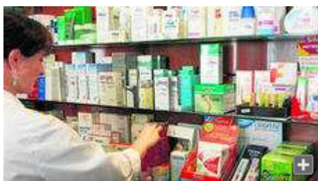
Una farmacéutica busca un medicamento en una estantería de su establecimiento.

Una simple píldora puede obligarnos a salir corriendo a Urgencias. Y no precisamente por una reacción alérgica. Olvidar la medicación o no tomarla de la manera prescrita puede provocar descompensaciones que en muchos casos acaban en el hospital. Diversos estudios alertan de la importancia de tomar bien los fármacos, aunque discrepan sobre qué porcentaje de casos vistos en Urgencias se deben a problemas relacionados con los medicamentos. Unos trabajos hablan del 4% y otros del 46%.