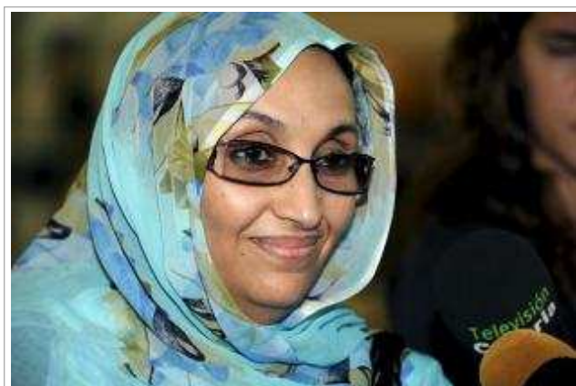
La activista saharauí Aminatu Haidar.

Madrid, 28 feb (EFE).- Los colectivos de defensa del Sáhara Occidental celebrarán el próximo fin de semana diversos actos reivindicativos en Granada, en víspera de la primera cumbre entre la UE y Marruecos, en los que esperan la reaparición pública de la activista saharauí Aminatu Haidar.