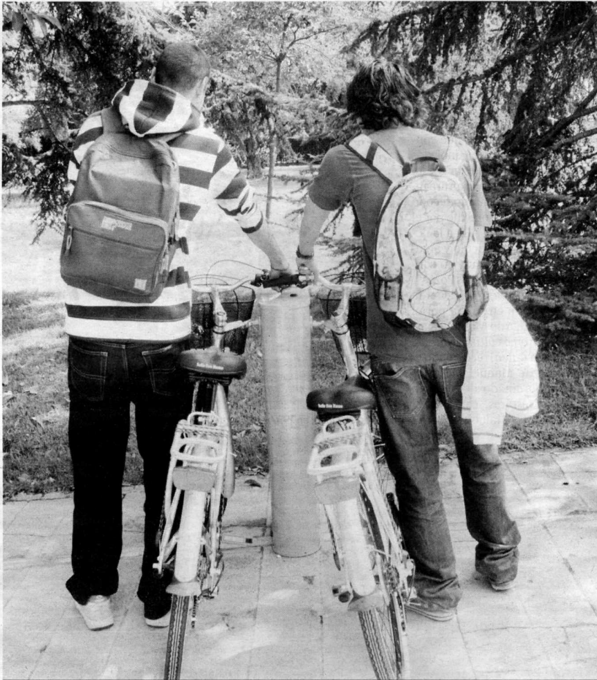
Dos jóvenes aparcan las bicicletas que acaban de alquilar para desplazarse de un campus a otro.

Según el primer informe elaborado por la UGR, la ruta más transitada por los universitarios cuando alquilan una de estas bicicletas es la que parte del Campus de la Cartuja hacia Fuentenueva, el destino también más frecuente de los que salen del Complejo Triunfo. Por su parte, los que parten de