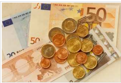
La provincia de Huesca es la número 14 en ahorro familiar por persona, con 3.260 euros.

La provincia de Huesca ocupa el puesto número 25 de España en ahorro bruto por habitante con 3.505 euros en el año 2008, un 35,3 por ciento menos que la media nacional de 5.422 euros y que la de Aragón, que es prácticamente idéntica a la española con 5.412.