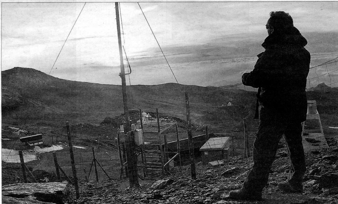
Un guarda toma notas junto a uno de los observatorios del cambio climático instalados en el Parque Nacional y Natural de Sierra Nevada.