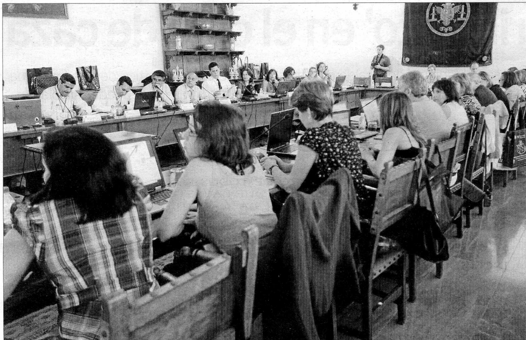
Representantes de universidades europeas y americanas, ayer, en el Hospital Real, durante la sesión constituyente del proyecto Monesia. CH. V.

UNIVERSIDAD. LA INSTITUCIÓN ACOGE UN ENCUENTRO INTERNACIONAL PARA FOMENTAR LA COLABORACIÓN ENTRE CENTROS