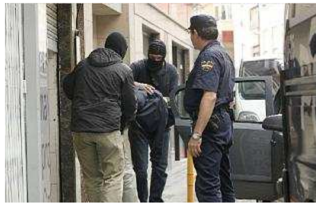
Un presunto integrista detenido en Vila-real en junio de 2008.

RAMÓN FERRANDO VALENCIA Un experto en terrorismo yihadista alerta en un informe de las relaciones entre los integristas islámicos de la Comunitat Valenciana con otras redes implantadas en toda España. Javier Jordán, que es profesor de la Universidad de Granada, advierte de que hay un "alto grado de implantación" del islamismo radical desde el 11-M. Jordán ha analizado los datos de las 28 operaciones policiales en España más relevantes desde marzo de 2004 y ha constatado que el 70% de los detenidos procede de Argelia y Marruecos. El documento, al que ha tenido acceso Levante-EMV, explica cómo es posible que una misma red se coordine con otras y con intermediarios de más de una organización. El estudio refleja que en varios casos los grupos están relacionados con Al Qaeda en Iraq y al mismo tiempo mantienen contactos con el Grupo Salafista para la Liberación y el Combate -cuyas células han sido desarticuladas en la Comunitat Valenciana- o con el Grupo Islámico Combatiente Marroquí.