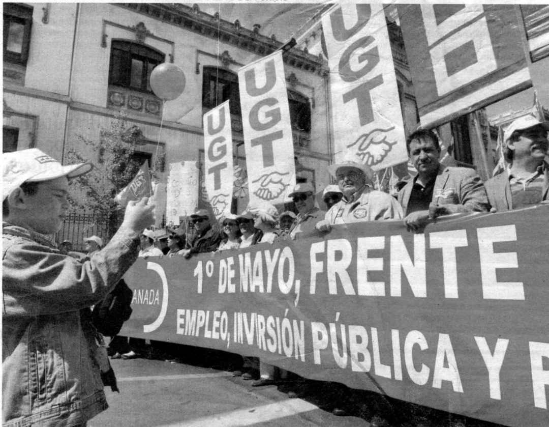
Cabeza de las manifestación del Primero de Mayo que ayer recorrió el centro de Granada.

6-7 Y 31 CONMEMORACIÓN BAJO LA AMENAZA DE LA CRISIS