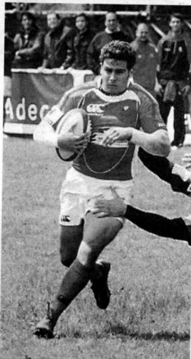
El motrileño con el oval.

Sin duda, se trata de un nuevo paso del deportista motrileño que ha llegado a vestir ya la camiseta de la selección española sub 21 y que milita también en la actualidad en el Cisneros de Madrid, equipo de la División de Honor del rugby nacional.