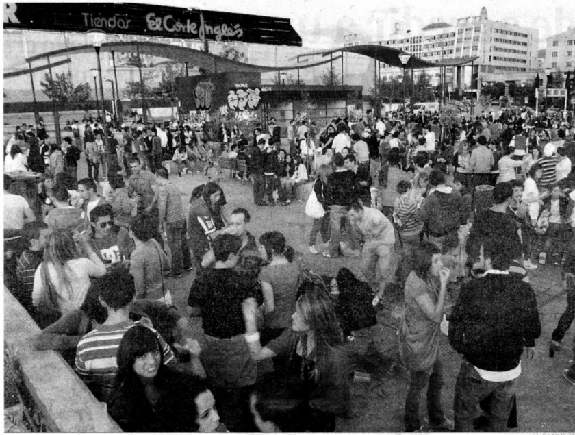
El recinto de la Huerta del Rasillo, ayer.