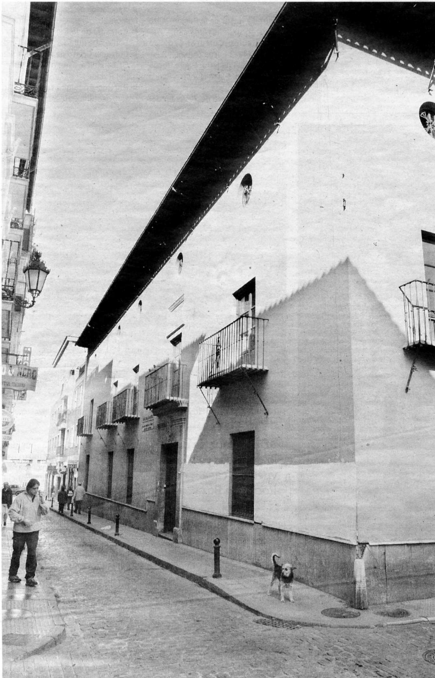
EN DESUSO. Edificio cedido a la Universidad, aún vacío, que alojará la ampliación de Derecho.

Los inmuebles ajenos y sin convenir se destinan a las actividades investigadoras de profesores y para personal de administración