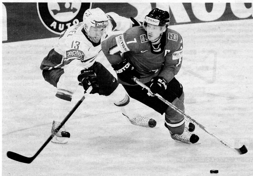
HOCKEY. Granada necesitará seis escenarios de hielo, cinco de nueva construcción.

Si la capital será el centro de los deportes de hielo, Sierra Nevada lo será de las pruebas de esquí, 'freestyle' y snowboard. En la estación invernal se desarrollarán ocho competiciones de alpino (slalom, slalom gigante, super gigante y combinada, tanto en categoría masculina como femenina), las dos de esquí artístico (baches y