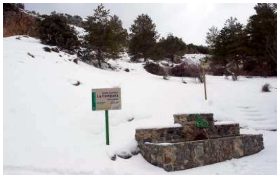
Vista del Jardín Botánico de La Cortijuela, cubierto de nieve, una de las dos instalaciones de este tipo existentes en Sierra Nevada.

Granada.- El Fondo Estatal de Inversión Local del Gobierno central invertirá 5,5 millones de euros en obras de conservación, mejora o rehabilitación de la Dehesa de San Juan y otros espacios del Parque Nacional de Sierra Nevada, actuaciones que crearán 110 nuevos empleos.