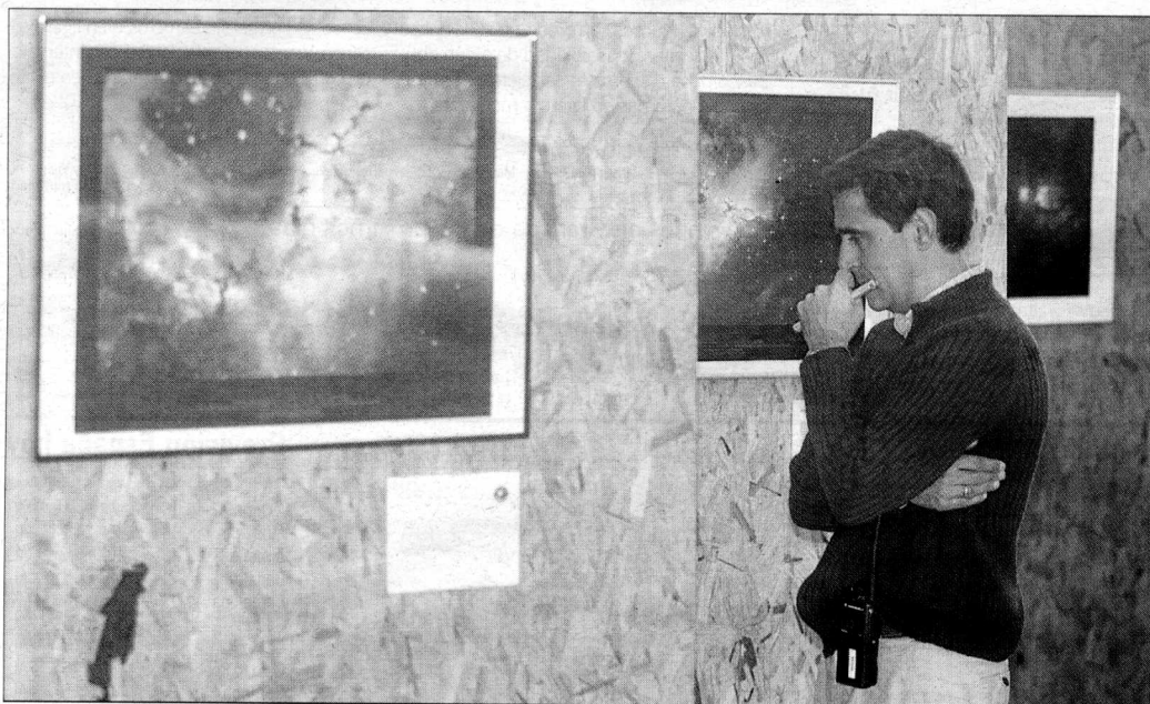
Espacio. Un visitante en la muestra 'Cosmos. Vistas desde la Nave Tierra', ayer. JUAN PALMA