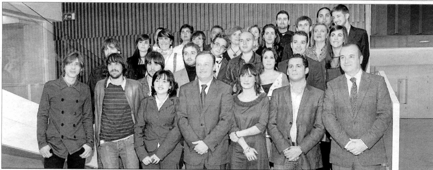
Los premiados, ayer, en el Parque de las Ciencias, donde se celebró la entrega.