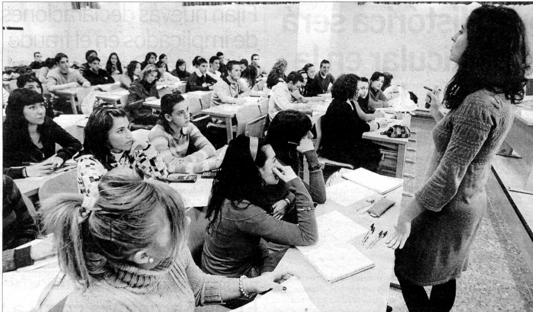
Una profesora imparte clase en la Facultad de Ciencias Económicas y Empresariales. RUIZ DE ALMODOVAR

UNIVERSIDAD. UN TOTAL DE 10.881 NUEVOS ESTUDIANTES PODRÁN ACCEDER A LA INSTITUCIÓN EN OCTUBRE