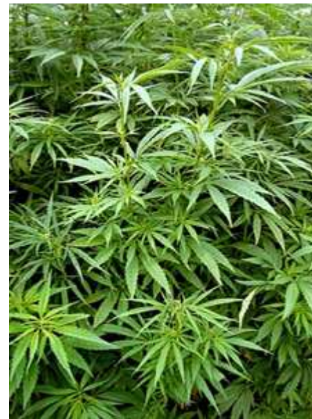
El consumo diario de cannabis predispone a la aparición de psicosis y esquizofrenia, según un estudio de la UGR

El consumo diario de cannabis predispone a la aparición de psicosis y esquizofrenia, además de que aquellos episodios de psicosis que son fruto de esta sustancia presentan unas características "específicas" tanto antes de aparecer como durante su manifestación clínica, según se desprende de un estudio realizado por el Instituto de Neurociencias de la Universidad de Granada (UGR).