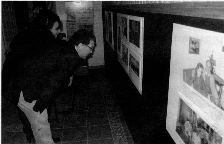
Fotografías personales del autor de 'La llanura'.