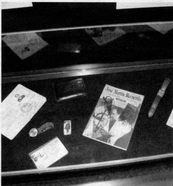
Gafas personales del autor sobre uno de sus libros.

"Hemos empezado a construir la casa por el tejado", señaló el director de la Fundación, en referencia a la ubicación actual de la sede en la planta más alta de la Casa Roja. No obstante, manifestó su confianza en que "esta vez el edificio no se nos derrumbará", puesto que la intención de los responsables municipales es que poco a poco se vayan sumando otras dependencias del inmueble a la