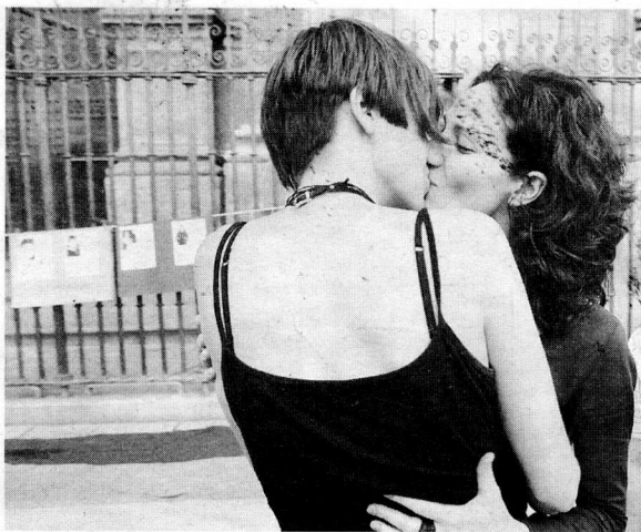
VISIBLES. Dos chicas se besan en una fiesta del orgullo gay.