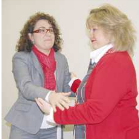
Acto de la firma del convenio.

La población con discapacidad en Melilla está de enhorabuena tras la firma de un convenio entre Cermi y la Fundación Universidad de Granada para la inclusión social de este colectivo, acuerdo que está financiado por la Ciudad Autónoma.