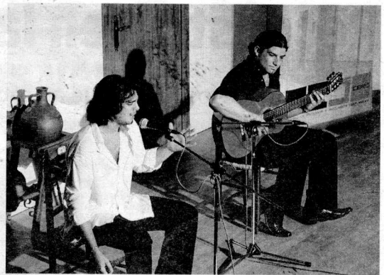
Una de las fases previas del concurso.

Usa siempre bases y ritmos elegantes, velocidades razonables y sonidos que se acercan tanto al 'easy listening' como al funk templado y el jazz.