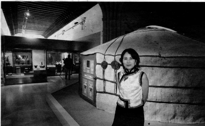
MONGOLIA. Arriba, tienda de campaña tradicional. Abajo, mongoles con ropas tradicionales. / G. MOLERO

'Un día en Mongolia' explica cómo se estructuraban y vivían las comunidades nómadas y qué relaciones establecieron con los pueblos de su alrededor. Toma como punto de partida los estudios etnográficos para mostrar la vida de los pueblos de Mongolia, que han conservado hasta hoy creencias y formas de organización social, entretenimientos y juegos. Las piezas están organizadas en torno a tres grandes temas: las formas de vida en la ger (tienda mon-