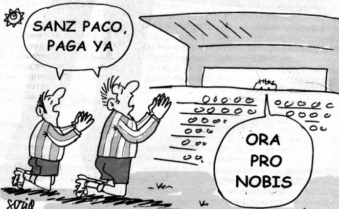
SUPERCRISIS EN EL GRANADA C.F.