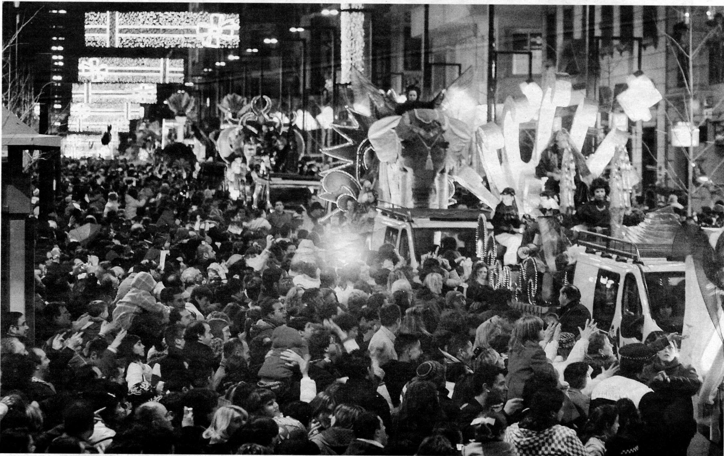
FIESTA DE LA ILUSIÓN. Y la vivieron miles y miles de personas en su recorrido por las calles de la ciudad. La Cabalgata no defraudó.