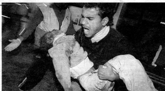
Un padre muestra su desesperación por la muerte del hijo.

pitaciones han dejado en Granada más agua en tres meses que en el último medio año. Pese a esta abundancia de agua, los pantanos se encuentran a sólo el 35,6% de su capacidad. PÁGS 2 Y 3