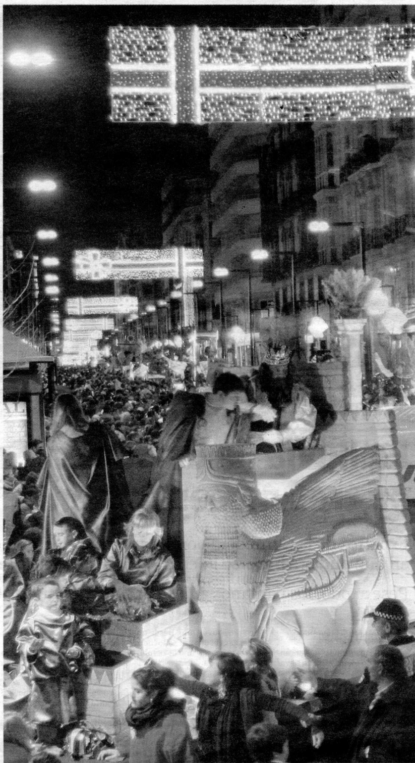
TODOS. Miles de granadinos se lanzaron a la calle para vivir el paso de la Cabalgata de Reyes.