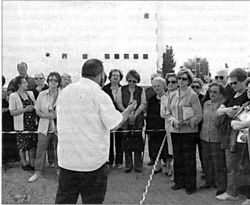
Visita. Alumnos del Aula Permanente, en la Huerta de los Lao. I. M.

Como novedad, la comarca acitana ocupará una parte destacada del programa en el curso 2008-2009, por lo que los alum-