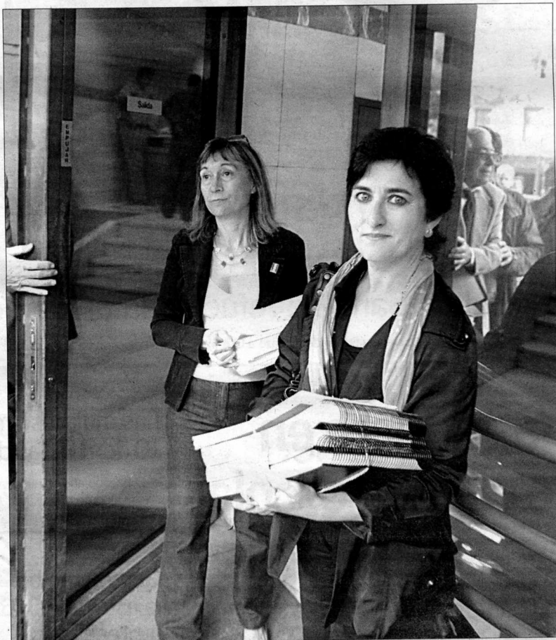
Entrega. Familiares y representantes de víctimas entregan al juez la documentación.