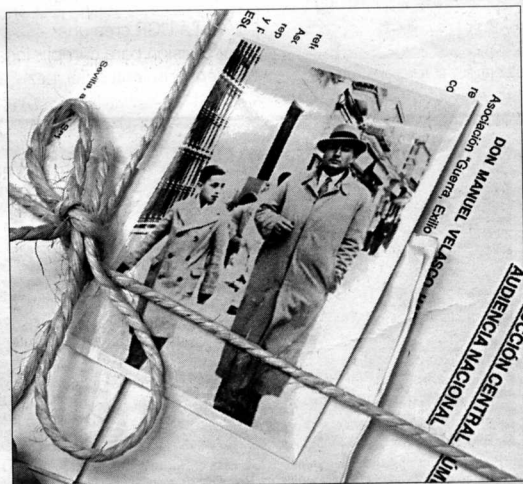
Documentación. Detalle de uno de los listados de víctimas.

el juez, servirá al menos para hacer "justicia histórica" y "dignificar la memoria de las víctimas".