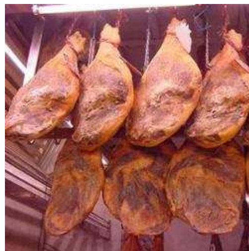
EP - Experto en nutrición recomienda el consumo de jamón serrano para prevenir el colesterol y enfermedades cardiovasculares

Finalmente, resaltó que el jamón serrano destaca también por su contenido en hierro del tipo "hemo" (fácilmente absorbible por el organismo) y en zinc, fundamental para el sistema inmune y para el crecimiento y desarrollo de niños y adolescentes.