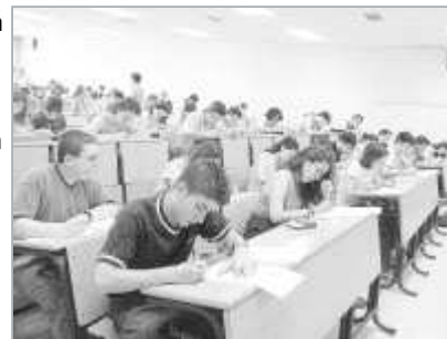
EN CLASE. Alumnos concentrados en un examen en las aulas de la Universidad de Jaén.

Pero sin duda, el cambio fundamental, tal y como explica la directora, se producirá en los créditos. Hasta ahora un crédito equivale a 10 horas de clase presencial y