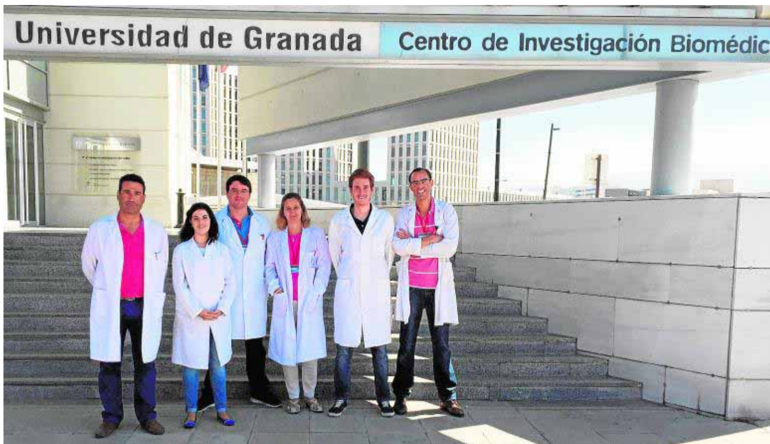
Científicos universitarios del Centro de Investigación Biomédica del Parque Tecnológico de la Salud.