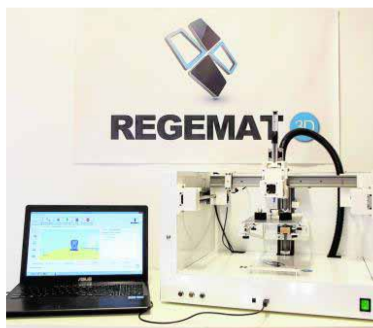
Modelo de impresora desarrollado por Regemat 3D.