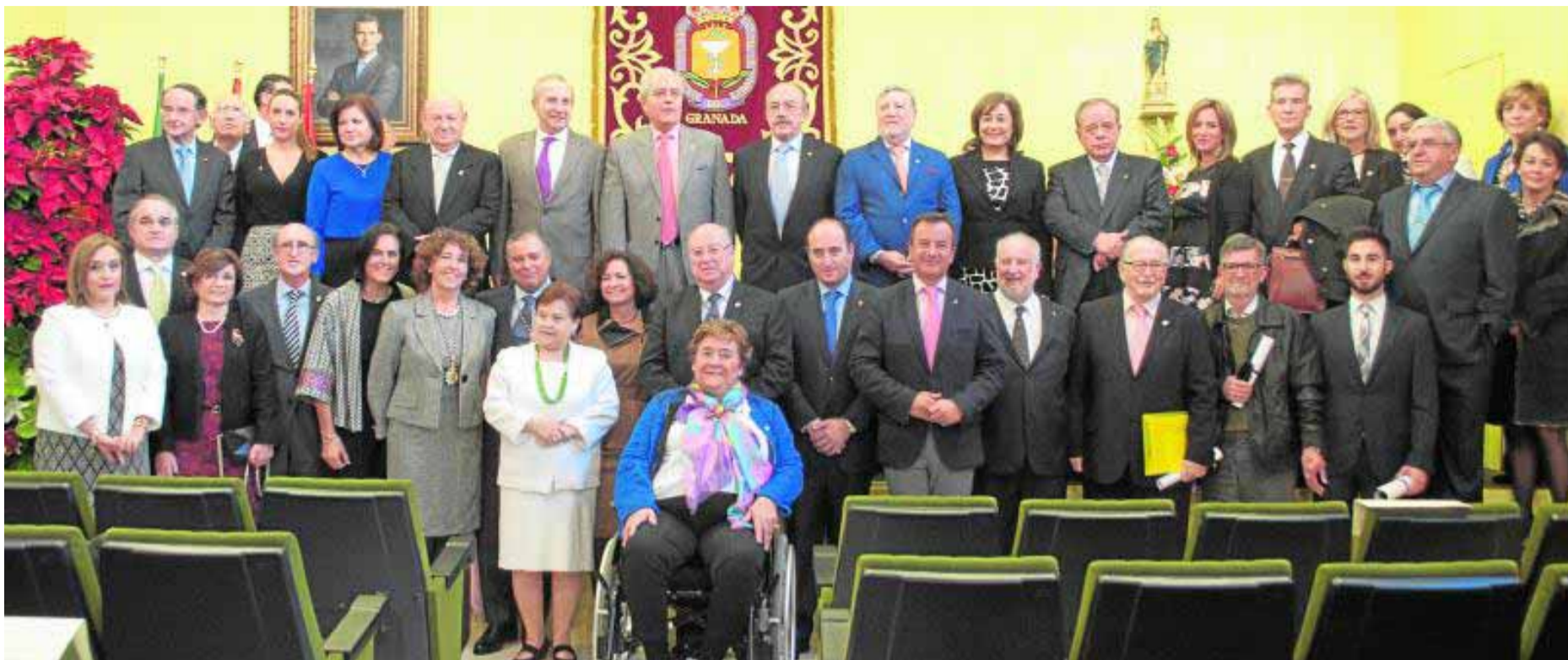
Los boticarios se recetaron un día de unión y amistad. :: ALEJANDRA GARCÍA