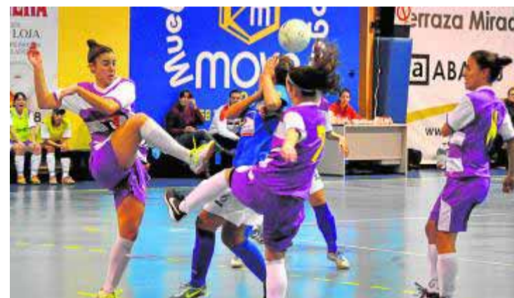
Loja y Monachil depararon un vibrante derbi provincial.

Además, este fin de semana se disputó un emocionante derbi provincial en Segunda femenina entre Loja y Monachil, con victoria para este último club (5-6). Las serranas cuajaron un gran choque, especialmente tras el descanso, y endosaron la primera derrota al conjunto del Poniente, que pierde así el liderato ante los triunfos de UCAM Murcia y Roldán B, con los que compartía el puesto de privilegio hasta esta jornada.