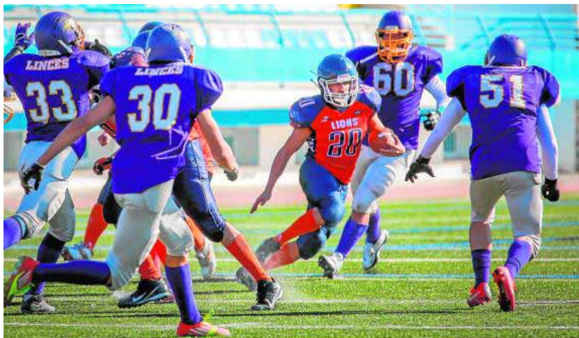
En el duelo de 'felinos', los Lions rugieron más fuerte.