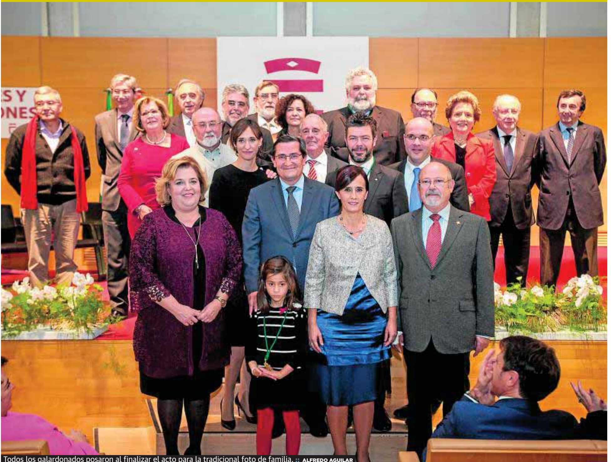
Todos los galardonados posaron al finalizar el acto para la tradicional foto de familia.

DIPUTACIÓN DE GRANADA ENTREGA SUS HONORES Y DISTINCIONES 2015 [P4Y5]