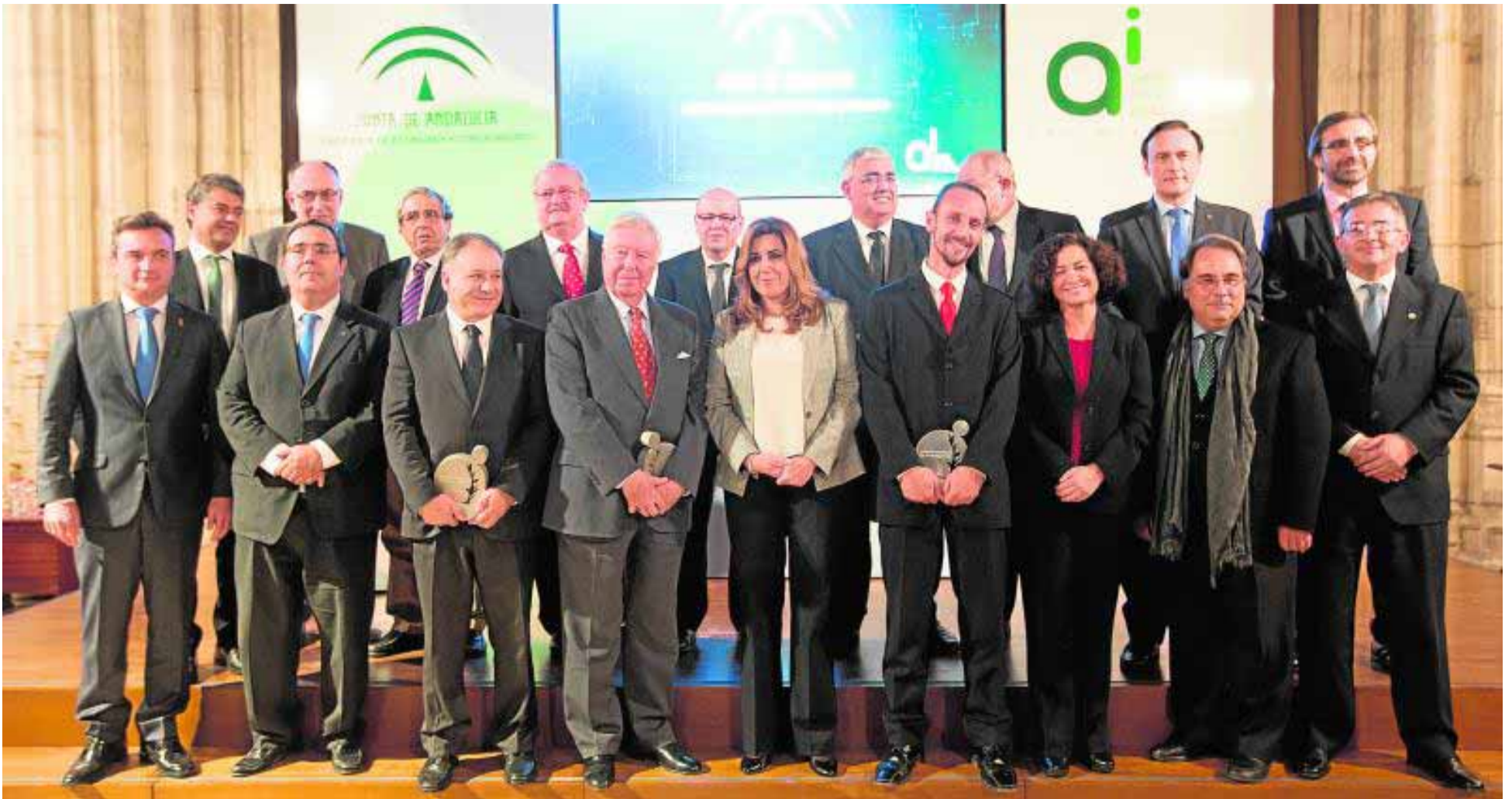
La presidenta de la Junta, en el centro, con todos los galardonados con los Premios Andalucía de Investigación.