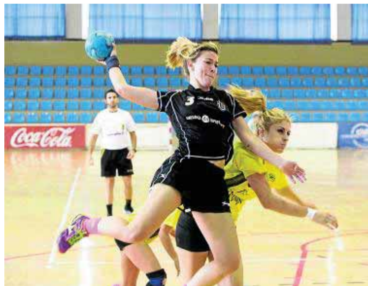
Imagen de un partido del Universidad en Fuentenueva.

En ese sentido, la visita al colista de la categoría supone una gran oportunidad para poner fin a su mala dinámica como foráneo. Los almerienses, de hecho, aún no han vencido un partido y lo más que han obtenido han sido dos empates. Sin duda, un gran aliciente para que los maraceneros salgan a por todas para sumar un triunfo que les impulse en la clasificación y no depender así únicamente de lo ganado en casa.