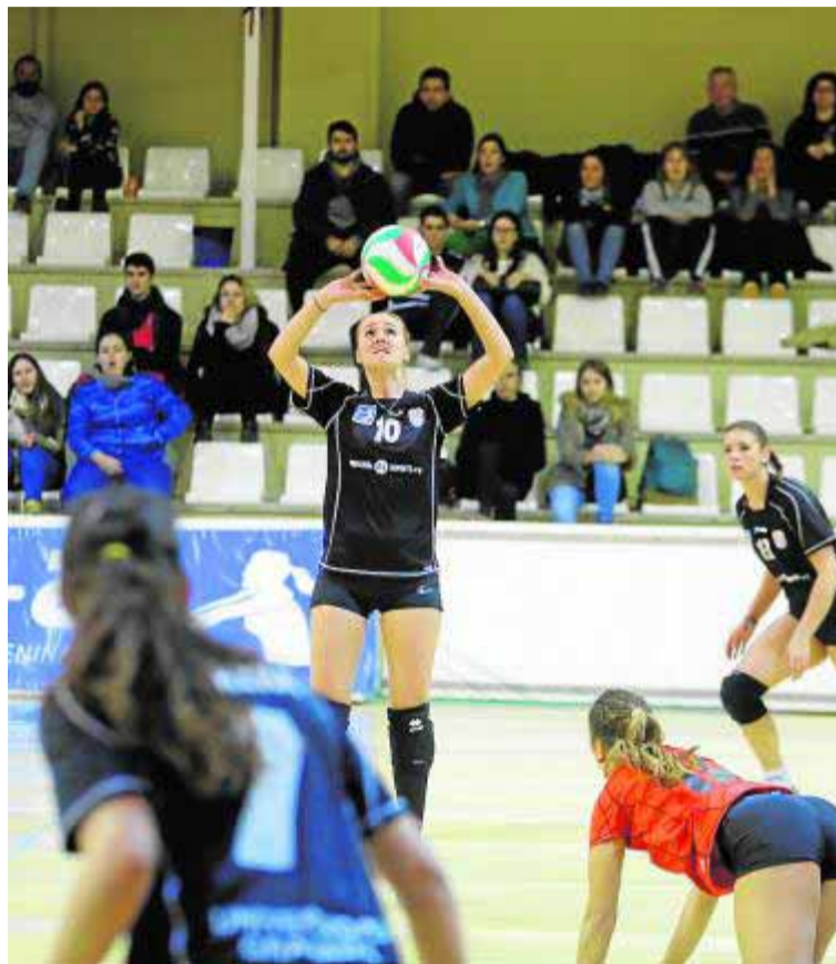
Imagen de un partido del Universidad femenino.

El 'Uni', que la pasada semana doblegó al Almería sin necesidad de recurrir al 'tie break' (3-1), que ya se había vuelto costumbre esta temporada, tratará ahora de certificar que este año no solo puede aspirar a la permanencia en la categoría de plata. A pesar de que ese era el objetivo inicial, los buenos resultados y el crecimiento de una plantilla que ha sabido sobreponerse a la inexperiencia de muchas de sus jugadoras permite ilusionarse con el futuro