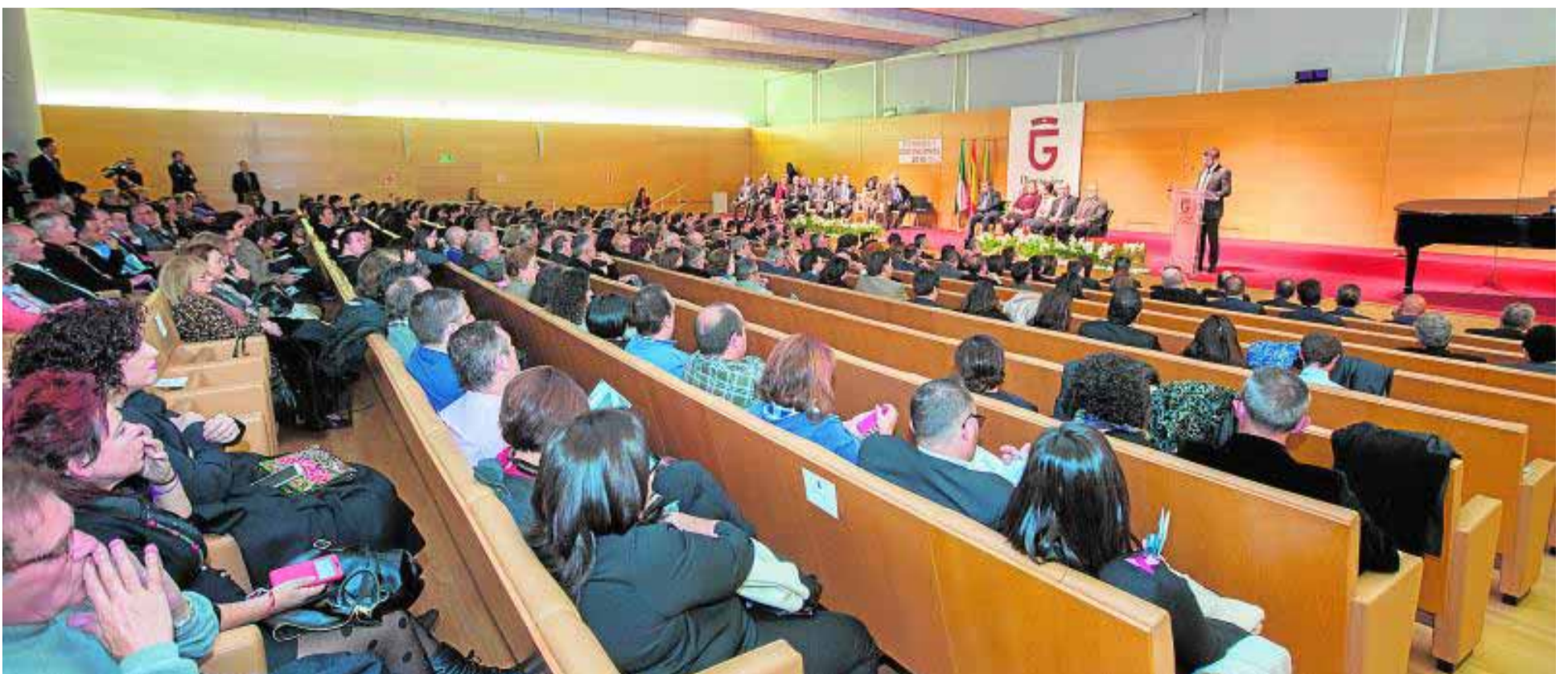
Casi 400 personas asistieron a la entrega de honores y distinciones de la Diputación, celebrada en el Salón de Actos de la sede de BMN-CajaGranada.

la fortaleza y la autonomía de los municipios y las comarcas». «Es hora de que Granada coja impulso, acelere el ritmo y acometa sin demora y con fuerza los cambios que debemos hacer, todas las reformas necesarias urgentes, para situar a esta tierra en el sitio que necesita y merece», concluyó el máximo responsable de la institución provincial.