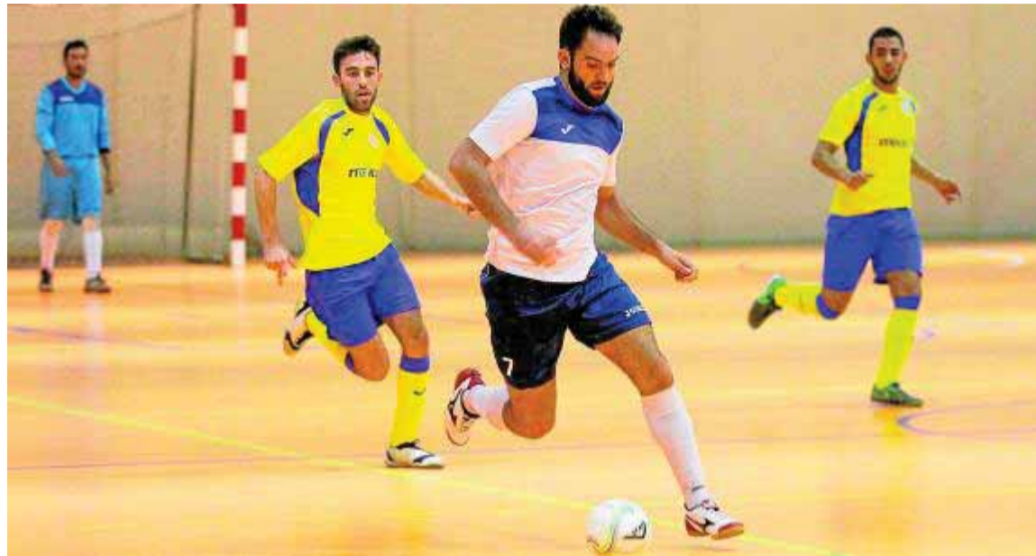
Lance de un partido anterior del Peligros en su pabellón

El técnico granadino considera que el conjunto sevillano «está haciendo un buen trabajo y es peligro-